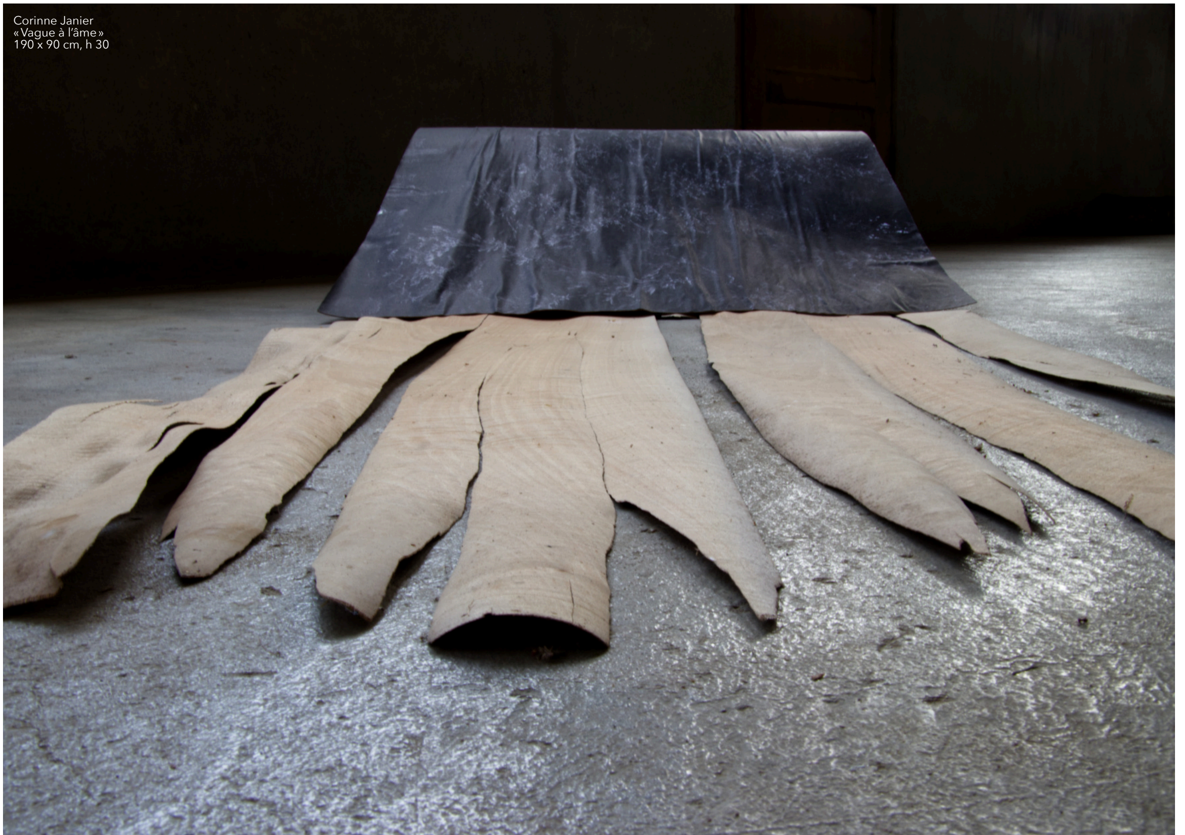
Corinne Janier «Vague à l'âme» 190 x 90 cm, h 30