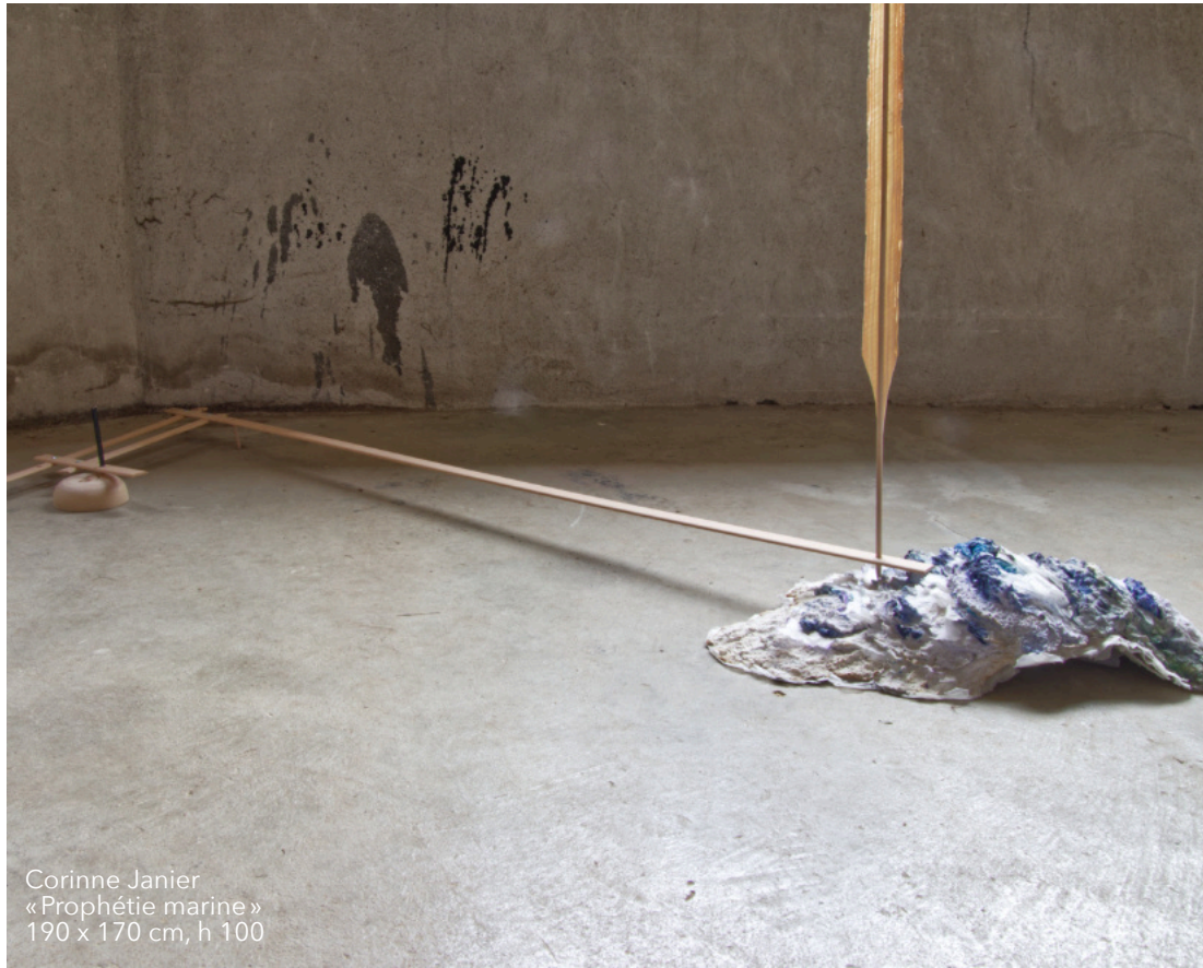
Corinne Janier « Prophétie marine » 190 x 170 cm, h 100