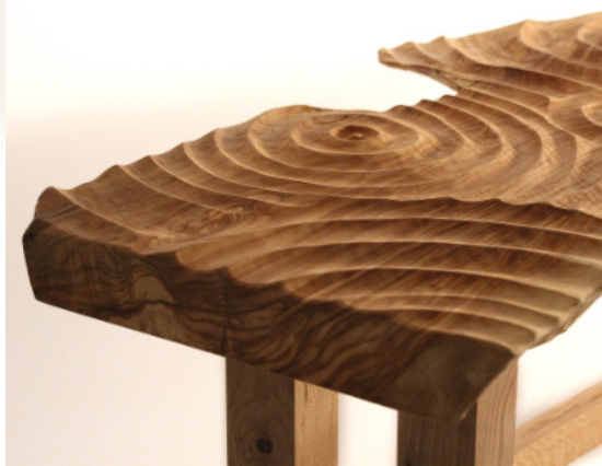
Jeremy Elbaz. L'araignée-cendrier Assemblages simples à tourillons sur petits bois profilés à la main. Hauteur 35cm, 50cm de diamètre. 2023. Potsuri-Potsuri Ébénisterie traditionnelle, assemblage à tenon-mortaise avec clé sans utilisation de colle, plateau sculpté. 2024.