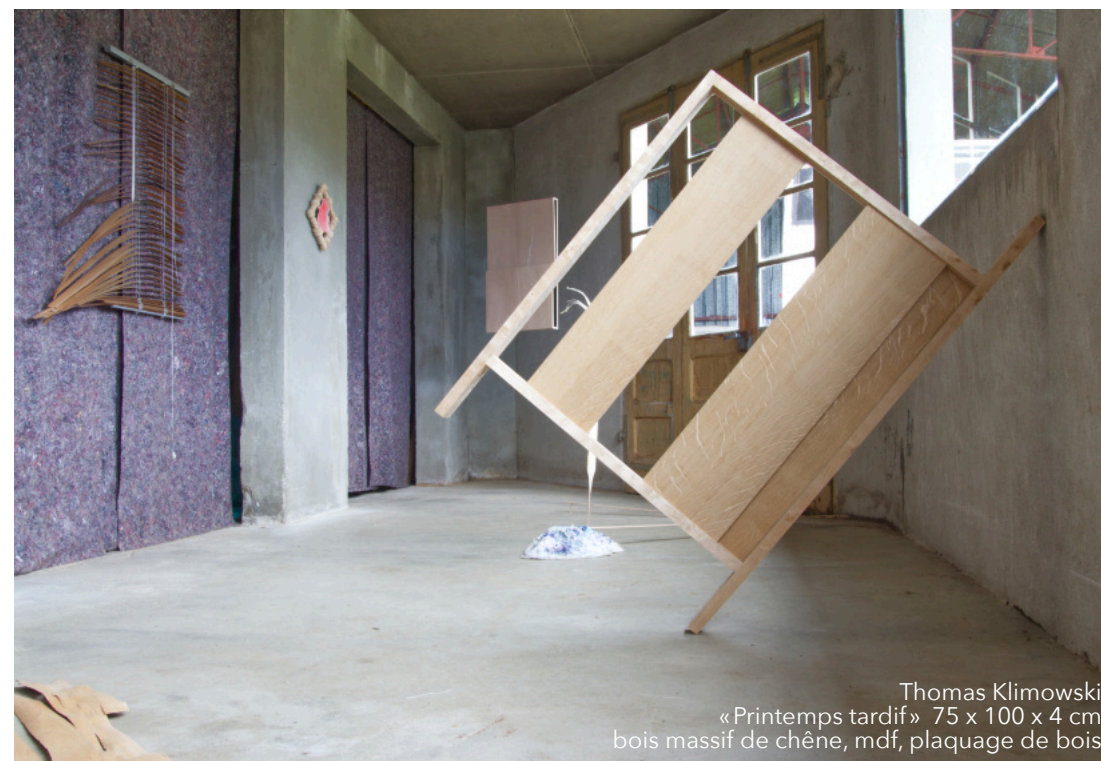
Thomas Klimowski «Printemps tardif» 75 x 100 x 4 cm bois massif de chêne, mdf, plaquage de bois