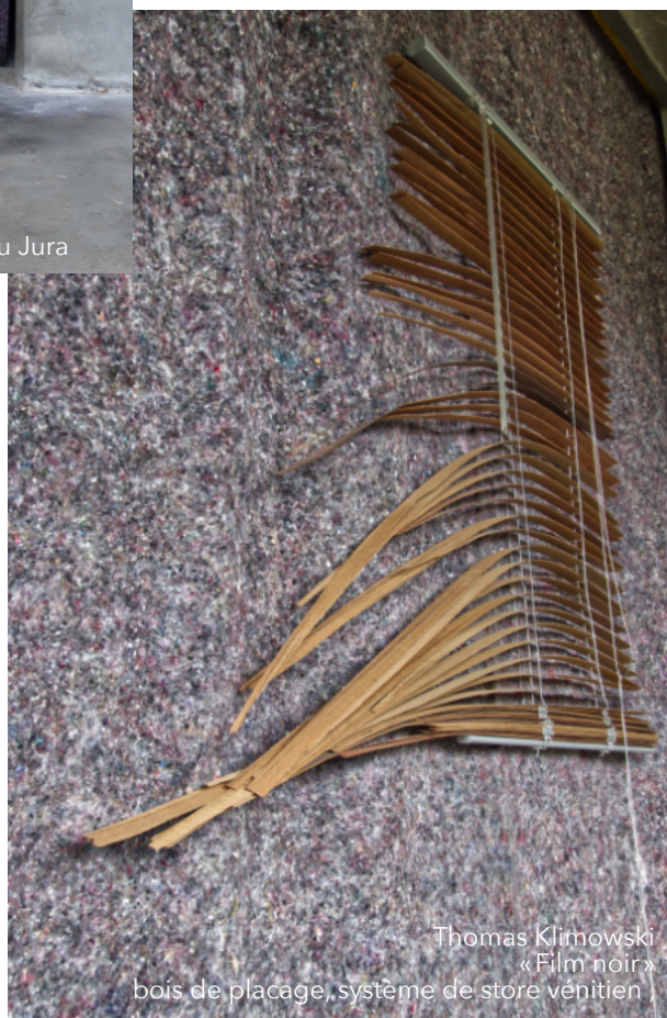
Thomas Klimowski «Film noir» bois de placage, système de store vénitien