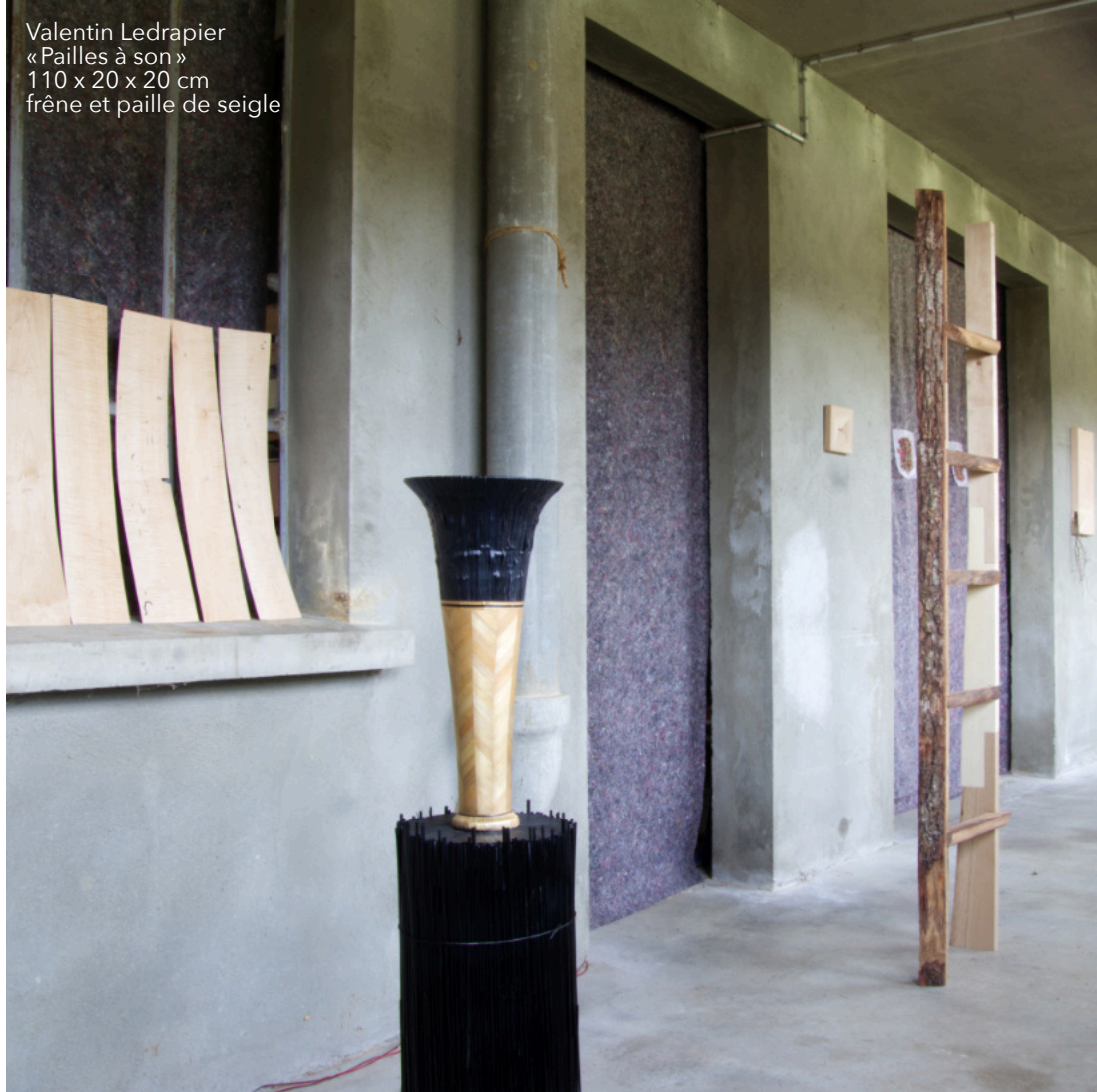
Valentin Ledrapier « Pailles à son » 110 x 20 x 20 cm frêne et paille de seigle