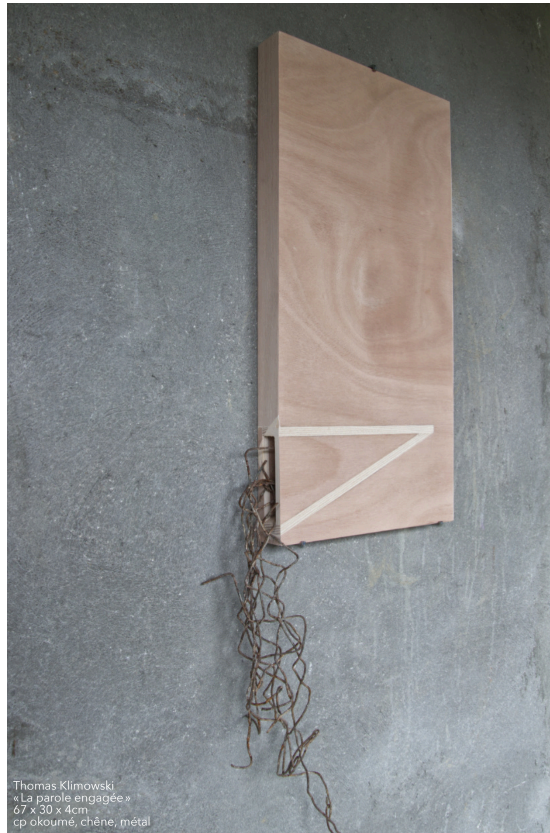
Thomas Klimowski «La parole engagée» 67 x 30 x 4cm cp okoumé, chêne, métal