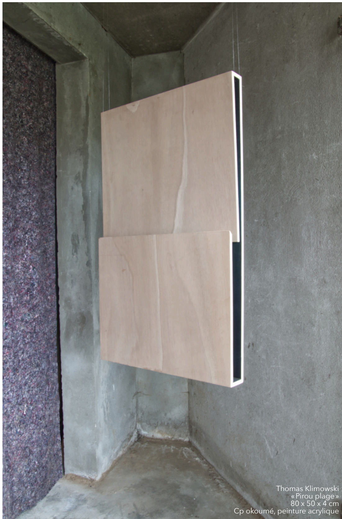
Thomas Klimowski «Pirou plage» 80 x 50 x 4 cm Cp okoumé, peinture acrylique