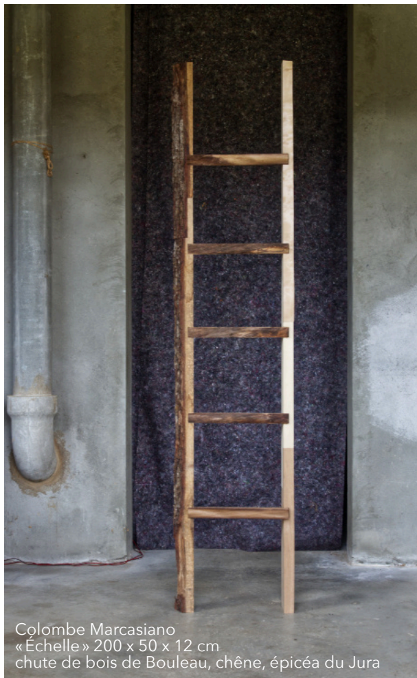
Colombe Marcasiano «Échelle» 200 x 50 x 12 cm chute de bois de Bouleau, chêne, épicéa du Jura