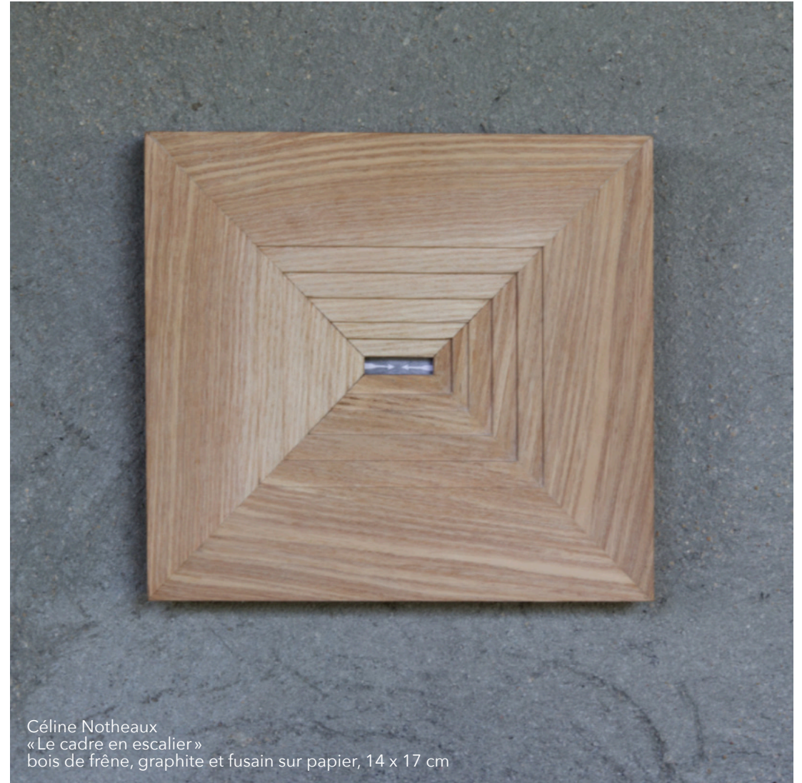
Céline Notheaux « Le cadre en escalier » bois de frêne, graphite et fusain sur papier, 14 x 17 cm