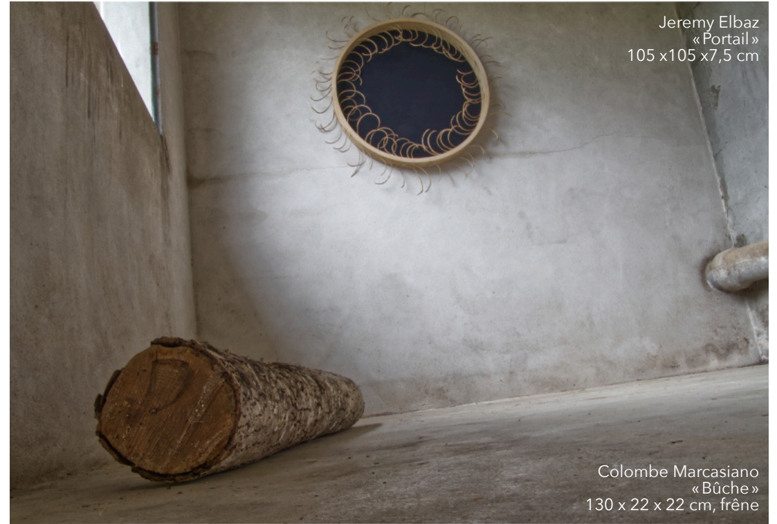
Colombe Marcasiano « Bûche » 130 x 22 x 22 cm, frêne