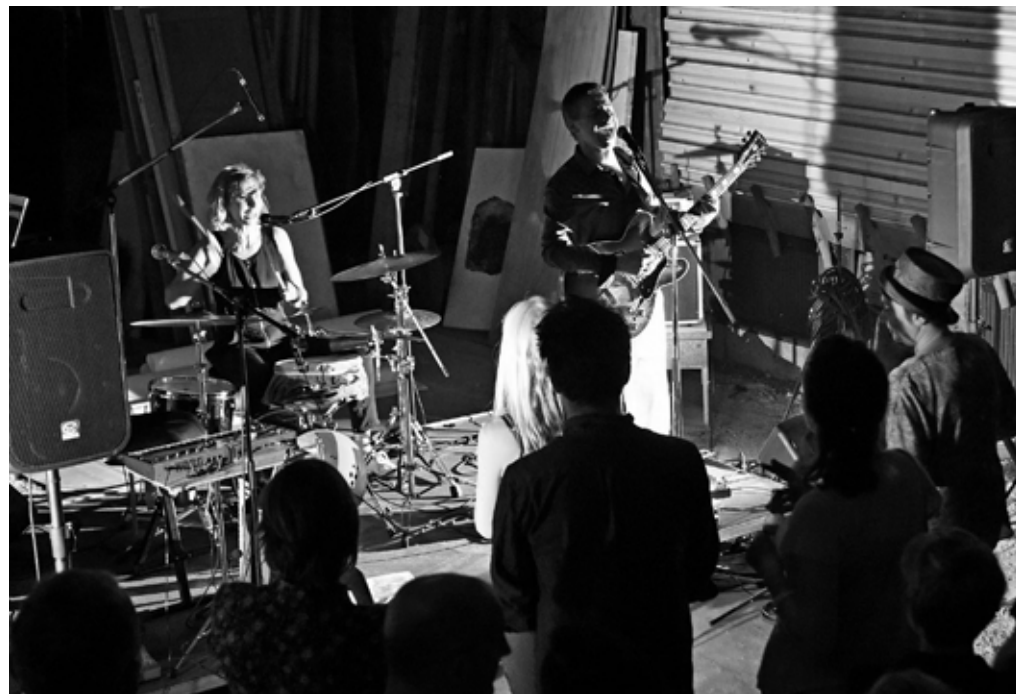
concert vernissage, photo : Jean Philippe Duret. erwtensoeep.fr

Ce périple Besançon, Mainz, Berlin, Neuenwalde, Migennes s'est conclu par la prestation du duo lors du vernissage de l'exposition.